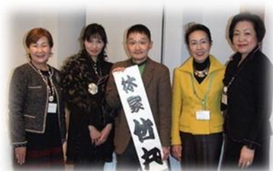
竹丸氏をかこんで