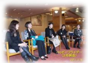
ハッピーフライデー 例会後のリラックスタイム